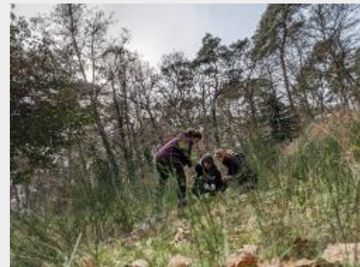
étude de la flore avant création de mare