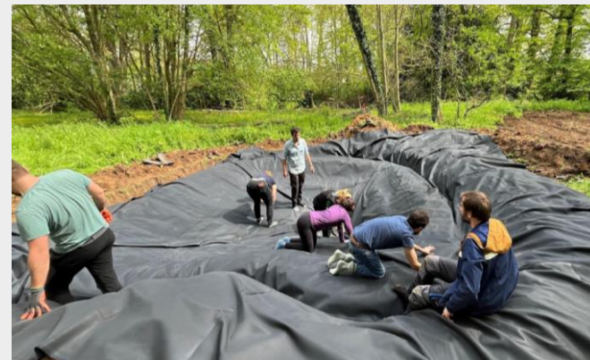
Chantier avec imperméabilisation par bâche et membranes